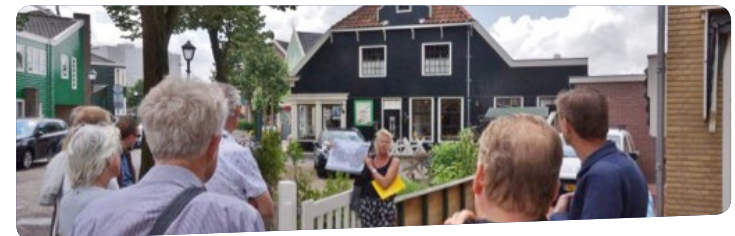
De foto's zijn van de rondleiding in Zaandijk